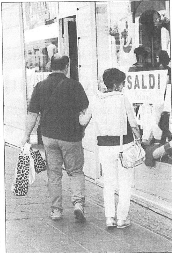
Saldi in via Pretoria (Mattiacci)